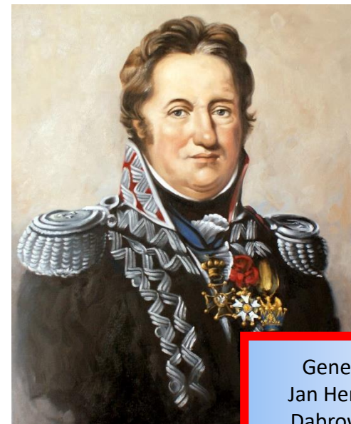
Generał Jan Henryk Dąbrowski

W czasie gdy Polska znajdowała się pod zaborami wielu Polaków wyjechało za granicę. Między innymi do Włoch i Francji. Właśnie we Włoszech zrodził się pomysł by stworzyć oddział Polaków, który walczyłby u boku Francji i Napoleona Bonaparte przeciwko naszym zaborcom. Dlatego we Włoszech ponieważ wówczas tam trwała wojna między Francją a Austrią. Oddział ten otrzymał nazwę Legiony Polskie. Ich przywódcą został generał Jan Henryk Dąbrowskim, który już wcześniej walczył o wolność Polski. Między innymi w powstaniu kościuszkowskim.